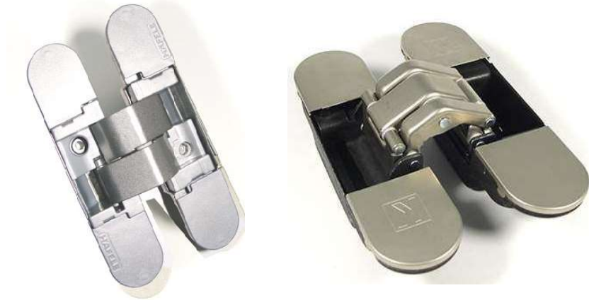
1. Петли скрытого монтажа