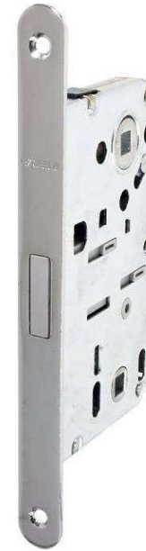
2. Магнитный замок